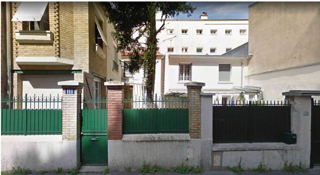
Rue des Haies, Paris