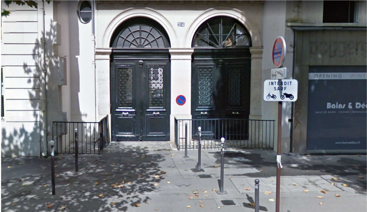
Boulevard Saint-Germain, Paris